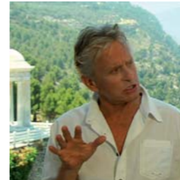
Michael Douglas · New Jersey, USA, 1944 Productor i actor de cinema

Possiblement, el compositor musical viu més important de l'actualitat. Ha produït 16 musicals, dues bandes sonores i una missa réquiem en llatí. Al seu currículum hi ha tres premis Tony, tres premis Grammy, un Oscar, un Emmy Internacional, sis premis Olivier i un Globo d'Or. Entre les seves obres destaquen Jesucrist Súper Star, Evita, Cats, El Fantasma de l'Òpera, la cançó Amics per sempre, del jocs olímpics de 1992 a Barcelona. Te una casa a deià des de fa 6 anys, on sovint hi ve a passar les vacances i a compondre.